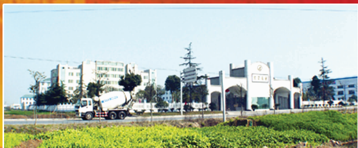
2010年度纳税大户巨龙管业